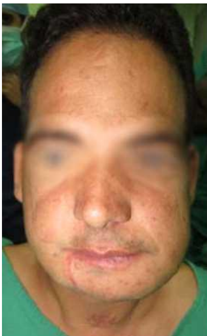
Fig. 1. Aspecto clínico preoperatorio. Acortamiento vertical del tercio inferior facial.

Por lo interesante de la situación clínico-terapéutica, se planteó caracterizar un caso de reconstrucción mandibular en una deformidad postquirúrgica por trauma.