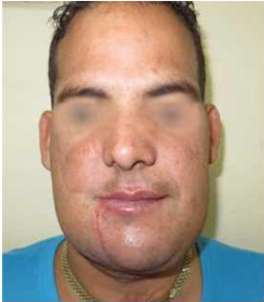
Fig. 3. Aspecto clínico posoperatorio (7 días después). Restitución de la proporción de los tercios faciales y de la simetría facial.

mandibulares con pérdida de la proyección mentoniana e irregularidad en el contorno mandibular de la región sinfisaria. Al examen bucal detectamos que se trataba de un desdentado parcial. Se observaba la movilidad de los segmentos óseos cuando realizaba movimientos de apertura y cierre de la boca, y al hablar.