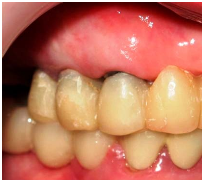
Fig. 2. Primer control. Ocho días después de realizada la cirugía.

Se realiza control ocho días después de la cirugía, se retiran puntos de sutura y existe un proceso de cicatrización dentro de lo esperado sin ninguna complicación y prótesis provisionales debidamente adaptadas (Fig. 2). Transcurridos seis meses existe adaptación de una nueva prótesis provisional. Al ser retirada se percibe leve recidiva de la lesión.