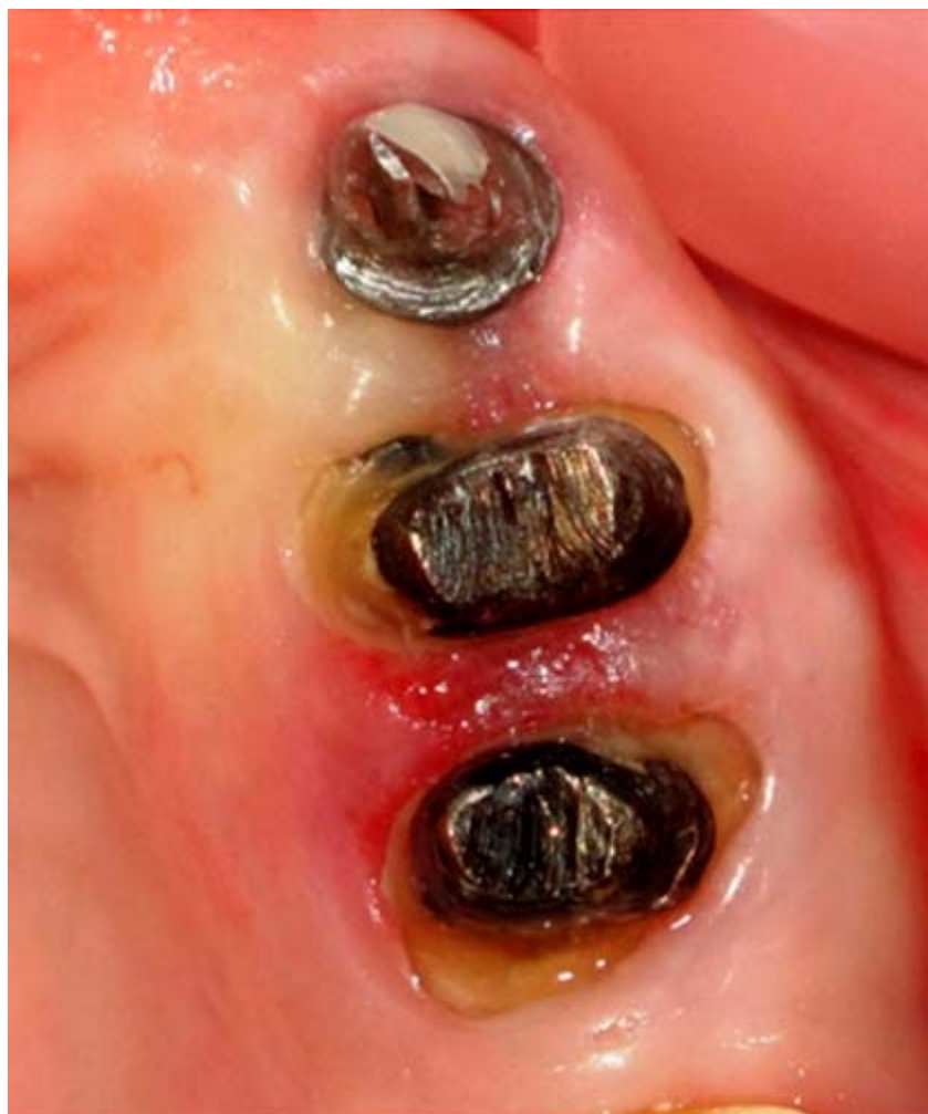
Fig. 1. Vista coronal hemiarcada derecha maxilar superior.

El plan de tratamiento inició con fase higiénica, motivación, enseñanza de cepillado, control de placa, raspado y alisado radicular con tartrectótomos (Hu-Friedy®) y ultrasónica (Cavitron®). Prescripción de enjuague bucal con gluconato de clorhexidina (Peridont®) en concentración de 0,12 % (7 mL de solución sin diluir) por un minuto durante dos semanas.