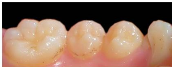
Fig. 1. Tinciones dentales de extensión 1, es decir, puntos o líneas delgadas de coalescencia incompleta paralelas al margen gingival.

edad y género (1 Masculino, 2 Femenino), presencia o ausencia de tinciones (0 y 1), extensión de las tinciones (0 ausente, 1, 2 o 3) AMH (0 sin AMH y 1 con AMH). Los estudiantes que obtuvieron código mayor que 0 en el componente C del índice COPD o del índice ceod fueron derivados. Además se otorgó información, orientación y consejería sobre este tipo de tinciones a todos los estudiantes participantes y sus padres. También se entregó un díptico informativo sobre caries y cepillado dental.