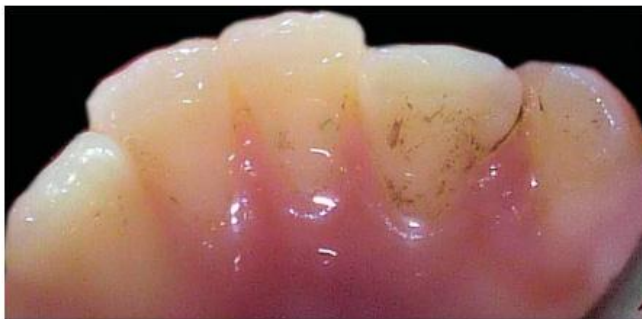
Fig. 3. Tinciones dentales de extensión 3, es decir, tinciones pigmentadas que se extienden más allá de la mitad del tercio cervical de la superficie dentaria.

De los 31 casos con tinciones dentales, 23 fueron de AMH (74,4 %). La distribución de tinciones dentales según historia de caries (COPD + ceo-d) se muestra en la