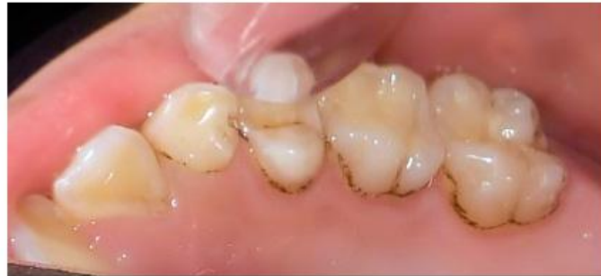
Fig. 2. Tinciones dentales de extensión 2, es decir, línea pigmentada continua fácilmente observada y limitada a la mitad del tercio cervical de la superficie dentaria.

Los dientes son muy susceptibles a cualquier cambio en el ambiente, sobre todo durante su periodo de formación y mineralización. 8 Existen, sin embargo,