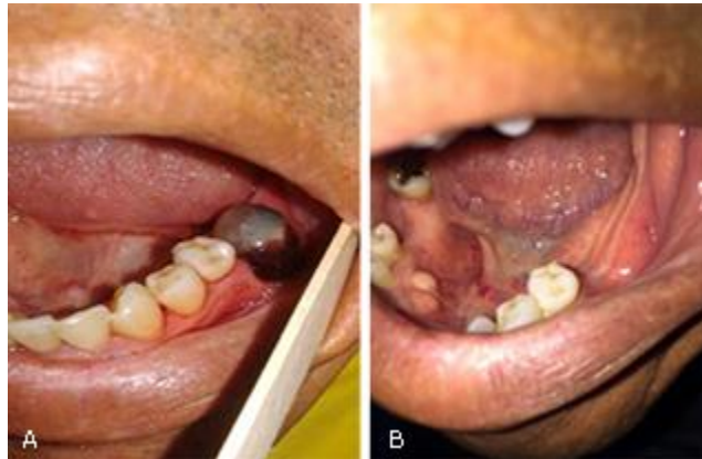
Fig. 2 – A: Paciente con HA leve, con coágulo inestable después de 10 días de la exodoncia del órgano dental 36, cuyo alveolo presentó un tiempo de sangrado espontáneo adecuado, y luego del control con cortes de puntos de sutura presentó la complicación, la cual fue controlada óptimamente. B: zona cicatrizada después de 40 días de realizada la exodoncia.

alveolar inferior y anestesia con infiltración lingual, podrían ser los únicos tratamientos que demandan hospitalización, debido a que corresponden a zonas anatómicas ricas en vascularización. (34) La cirugía periodontal, así como los procedimientos de exodoncias por método abierto en pacientes con hemofilia siempre debe considerarse como un procedimiento de alto riesgo con significativa pérdida de sangre, puede ser un desafío mayor a la hemostasia que una simple extracción, comúnmente la hemorragia posoperatoria suele ser un reto (Fig. 2, A y B). (4)